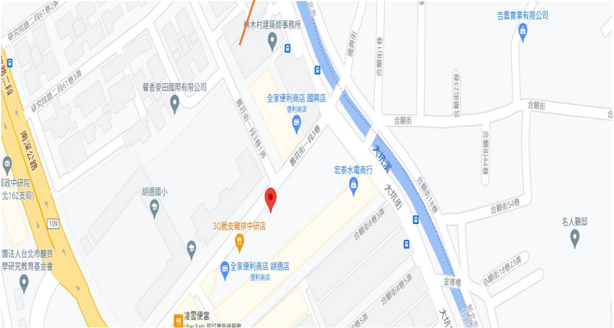
中南社會住宅(社宅周邊圖)