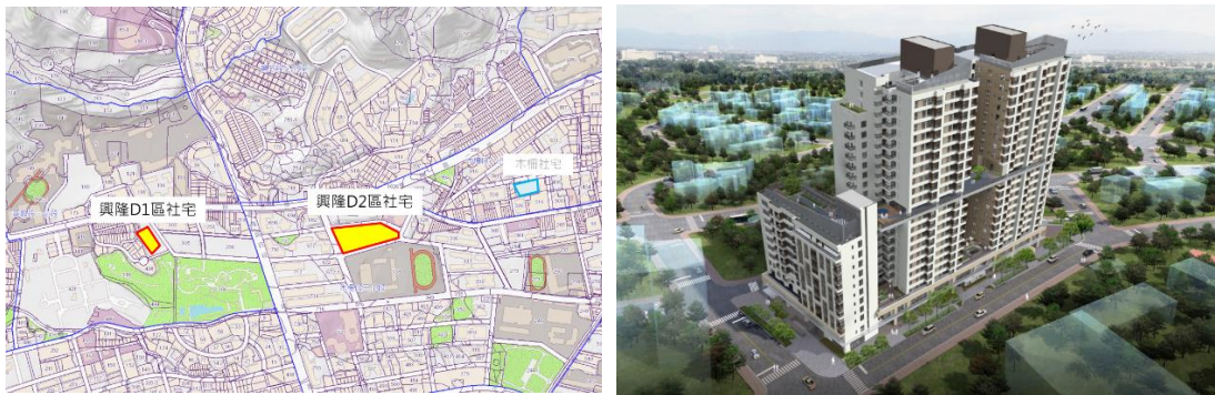
圖5 基地位置及現況示意圖