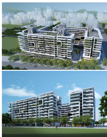
圖1 基地位置及建築模擬示意圖