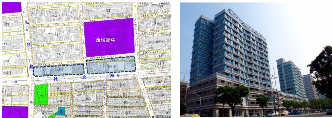
圖4 基地位置及建築模擬示意圖