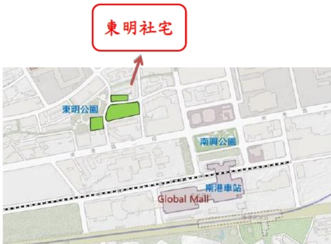
東明社會住宅(社宅周邊圖)