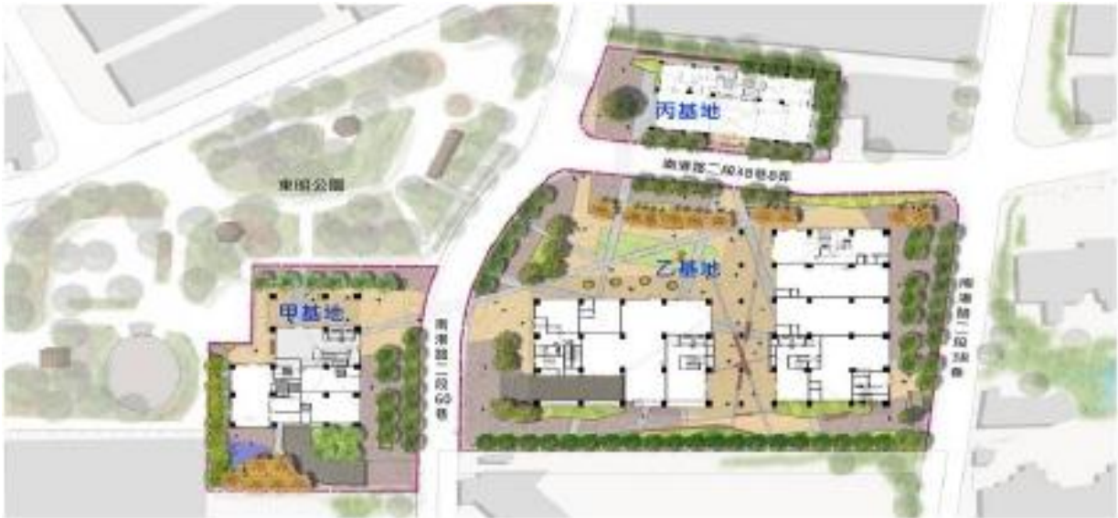
東明社會住宅(一層配置圖)